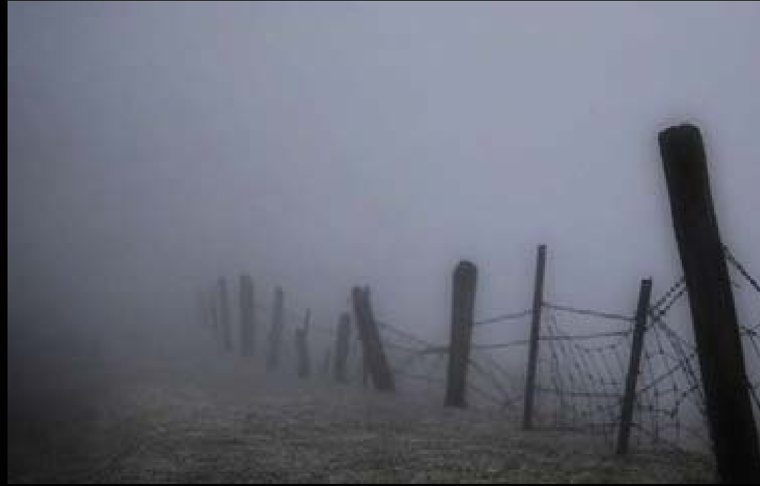
شۆره یه ک له ناوچه یی گه لی پیرمام-هه ولێر

دابەش بوونی تیشک و رووناکی، روانینی تاییه تی دەوی له لایه ن فۆتوگرافه ره وه، گەر به دروستی گوشه ی کامیرا هه لبژێدریت ئه و داهینانی له و دیمه نانه ی کاکه سه فین تۆماری کردوون، ده بینن ئه و ئیدیعیایاتانه ره ت ده کاته وه که گوایه فۆتوگراف کاریکی سه رپینی و ته نیا راگوێزانی سروشت و واقع بێ به شیوه ئالی.