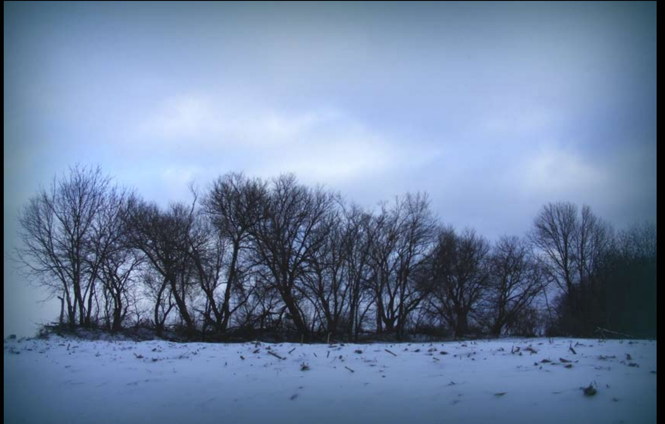
داره بزماره - له نێوان هاوینه هه واری پیرمام و هه ولێردا