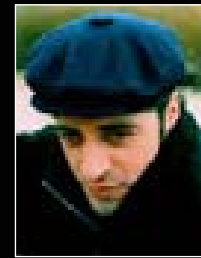
سه فین ئه حمه د

توزع الأشعة و الضياء يتطلب نظرة خاصة من لدن المصور الفوتوغرافي، اذا ما اختار زاوية الكاميرا بشكل سليم. هنا.. الابداع الذي حققه كاكه سفین في هذه التصاور، تفند تلك الادعاءات القائلة بأن فن التصوير الفوتوغرافي عمل بسيط و عابر و يعبر فقط عن الطبيعة و الواقع.