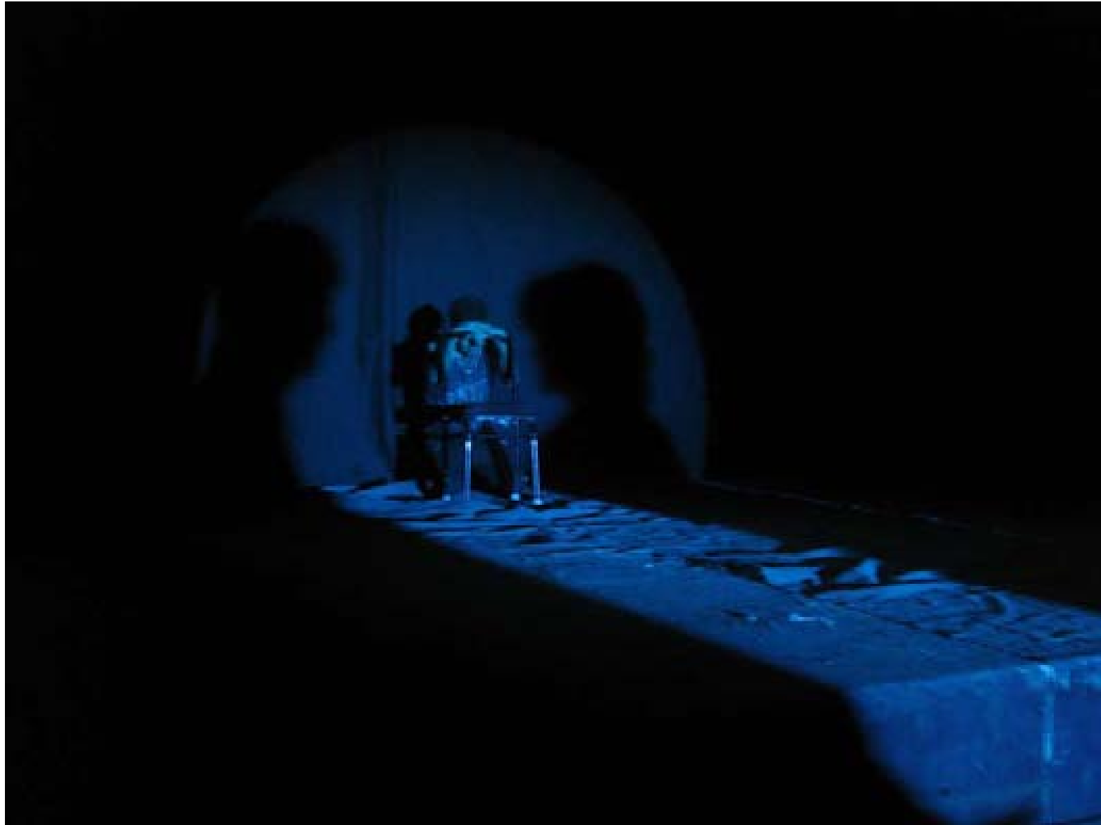
چوونهوه بۆ ناو خود