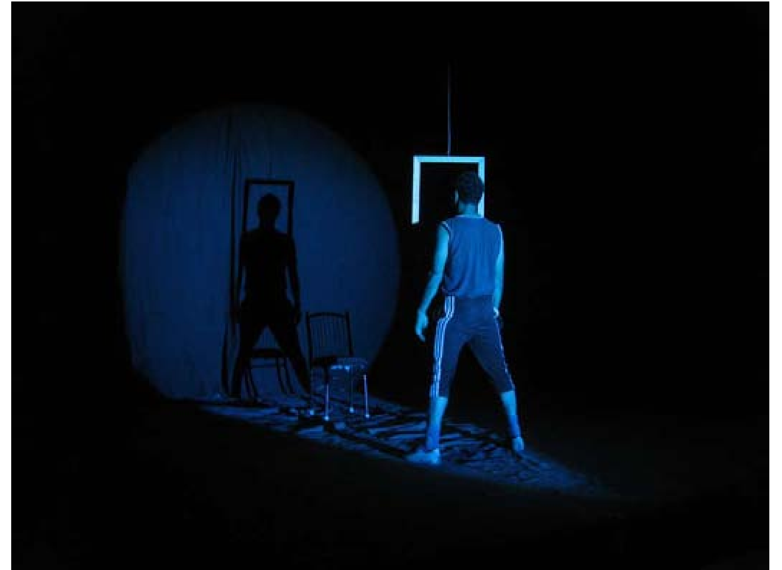
بههنگاربوونهوهي گههنيک له بهرامبهه تارمايي خویدا

سنيهرو جووله لهم ويتانهدا بهرهو قولاييمان دهبن، تيکچرژان و ئاويته بوونيكي ئەنديشاوي له نيوان فيگهرو سنيهههکاندا ههه بهتارمايي چوارچيوه سروسشتي ئەم ويتانه دانراوه، ليزهه ههست بهتهزووي پيککهيشتنی ژيري و ههستهکان دهکهين.