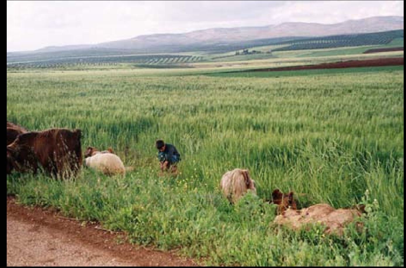
راعي کوردي بجانب حقول القمح

کوردستانی گه وره چه ندين شوینی قه شهنگی تیدایه، به تاییه تی رووبه ری ده شتایی و کشتوکالی تیادایه، که هر له میژه وه وهکو نه ریتیک گوزهرانی خه لکی کوردستان له سه ناژهداری و کشاوه رزیه، (عه فرینیش) به کیکه له شه قه شهنگانه ی کوردستانی سوریا، که زۆریه به ره مه کشتوکالیه کانی بز ته وای ولاتی سوریا و ده وره ری سوودی لیوه ده کیریت.