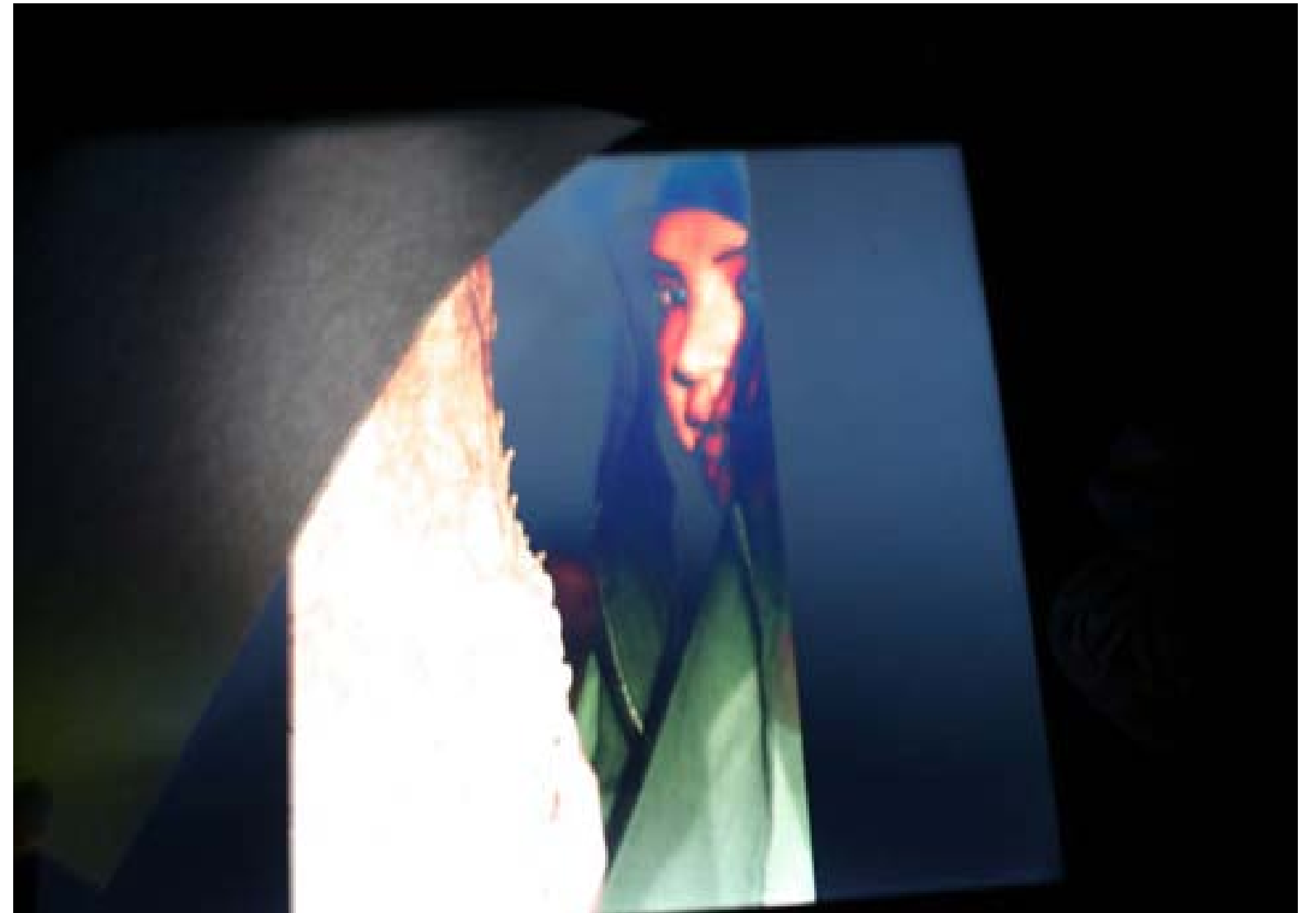
لایەكى سیمای ئافرەتتىكى خەمبار لەنیوان سىبەر و تارمايى و دیوار و دارىكدا