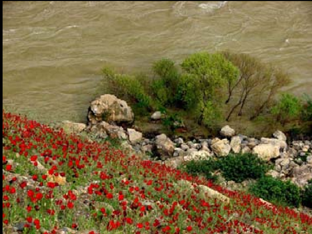
لیواری گردیک بهته نیشتر رووباریکدا- بهاری کوردستانی ئیران