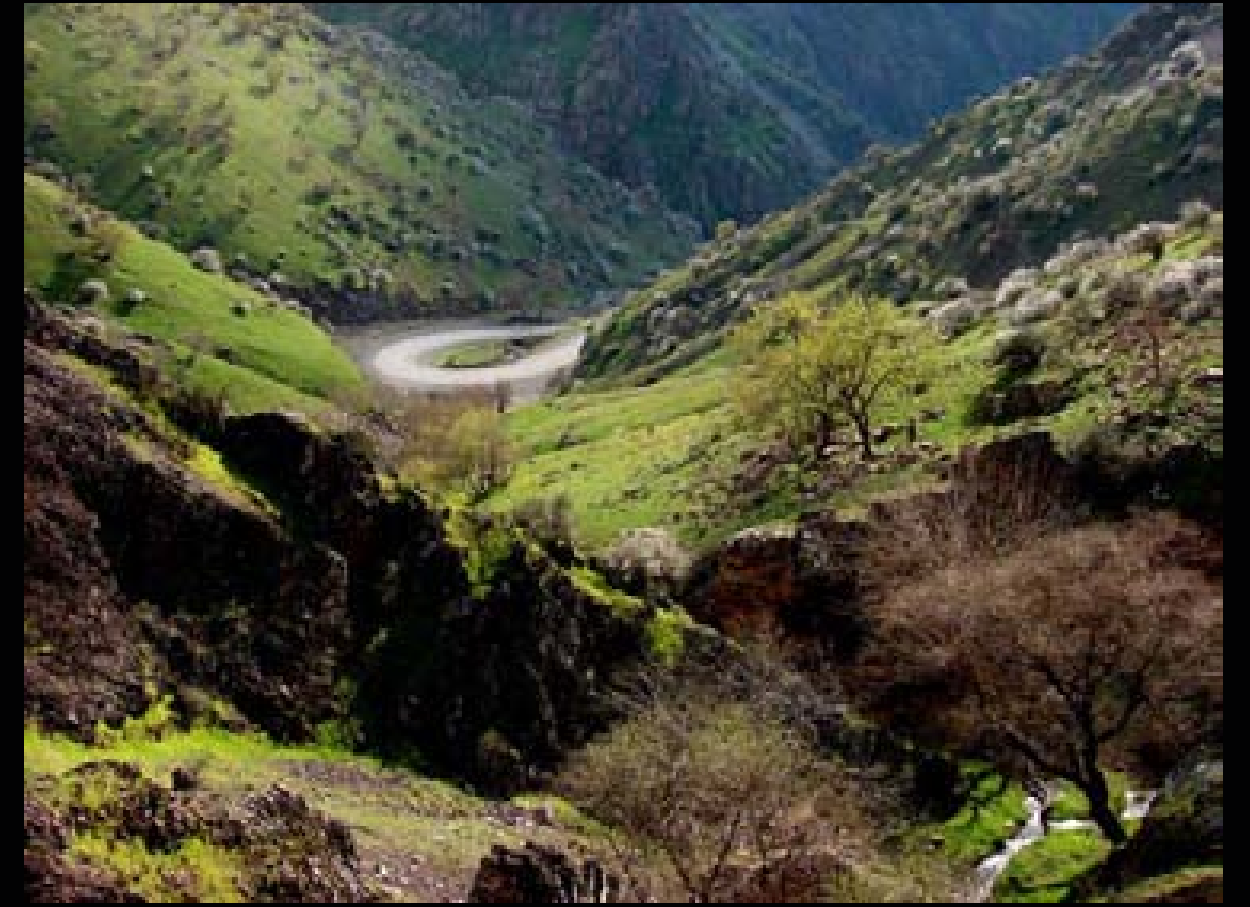
جادههکی پیچاوپیچ له ئامیزی دۆلیکی نیوان دوو شاخی کوردستان