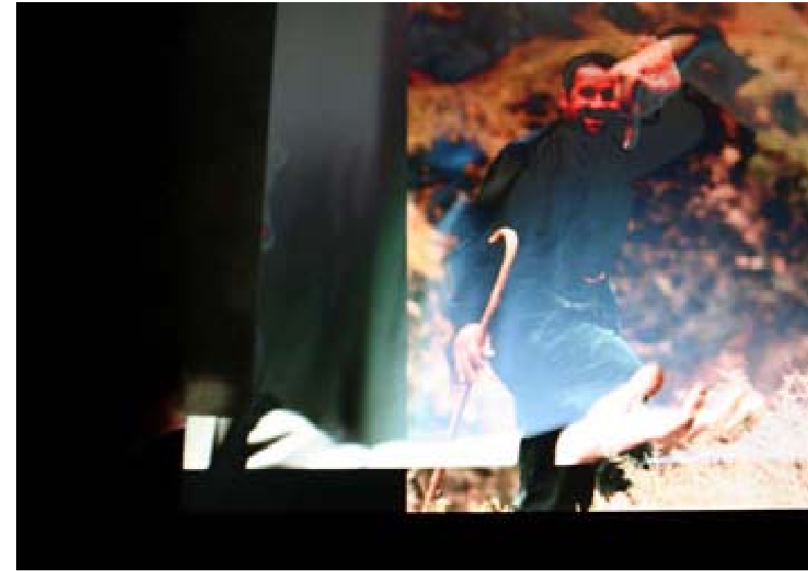
مروفيك گۆچانينكى به دهسته وهيه و دهستينك له وينهيه كي ديكه دا چيروكيك نمايش دهكهن

سوران نقشبندی ينظر الى المرأة و الصورة التلفزيونية فقط من خلال التحليل التلسكوبي. يحاول أن يجعلنا نتعرف على أساسيسه أمام الحقيقة الخارجية. و لا يهم كيف تكون مواضيع صوره. المهم هو أنه هكذا يبرز لنا الحقائق. أي أننا و كمتلقين نستطيع أن نسأل هل أن صور سوران نقشبندی تعدم الحقيقة أم أن هناك تعامل فني ما في هذه الصور؟ ان ما يمنح القيمة للصورة هي تلك العلاقة التي ينشأها المتلقي مع الصورة.