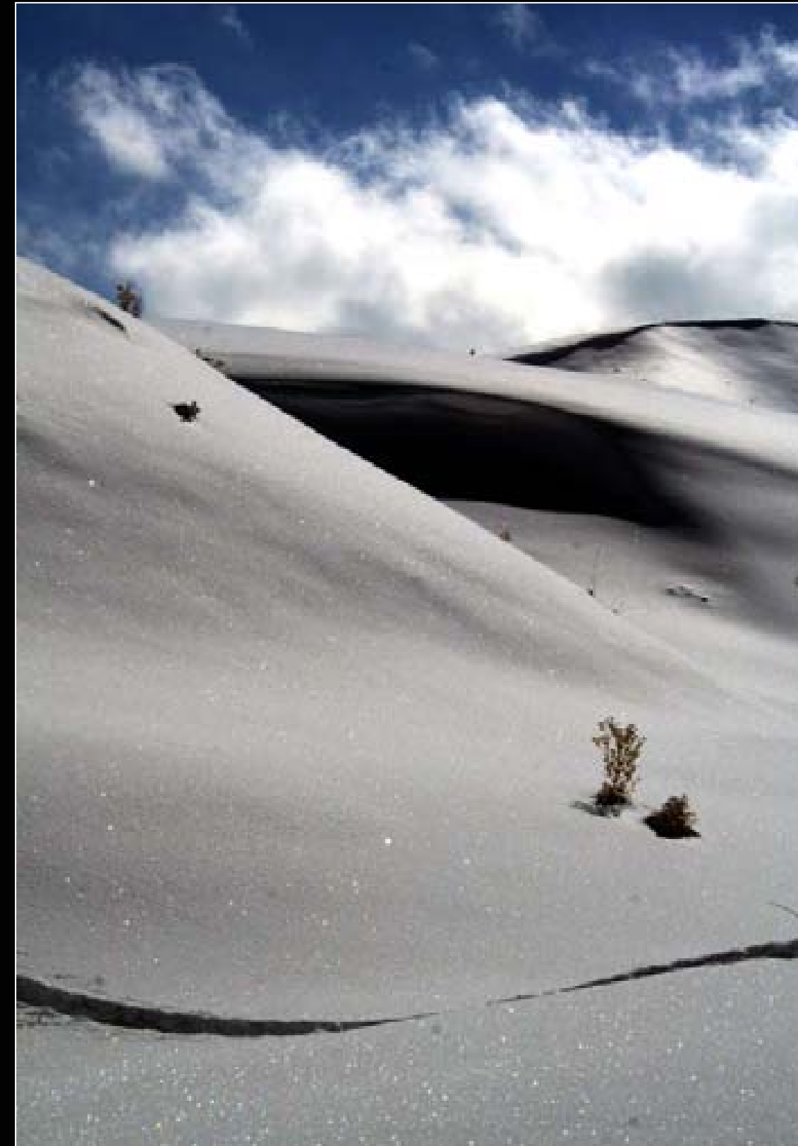
چەند تەپۆلکە یەکی بەفرین له ناوچهکانی کوردستان