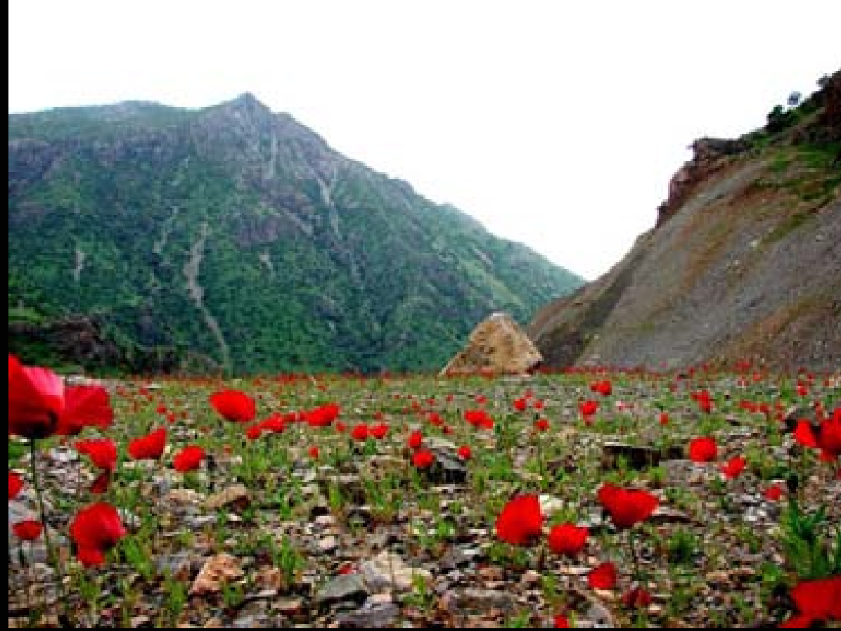
گولاله سووردهی کوستان له وهرزی بهاری کوردستاندا