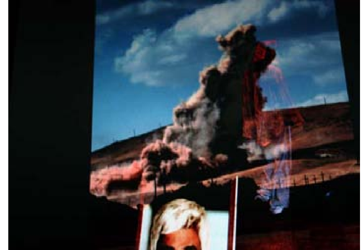
تيكه لېوونه وهی 3 وينهی ته قينه وهو فيگهر و وينهی شه هيديك له ئاميز دهگرن