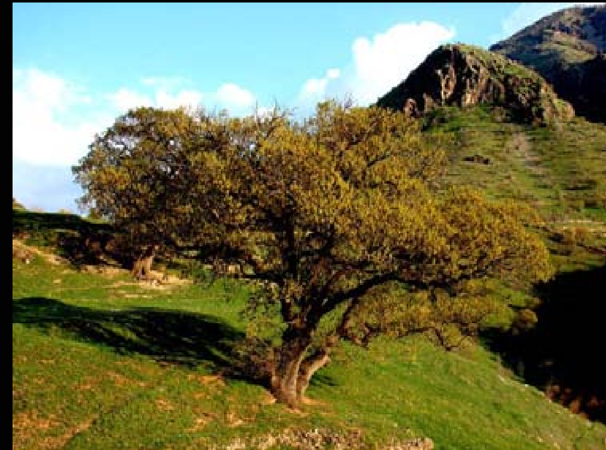
درهختیک له وهرزی بهاردا- کوردستانی ئیران

في صور سلام حاجي علي تم تخصيص ثلث الصور للطبیعة و جمال الأرض. في بعضها هناك الاهتمام الفني بمقدمة اللقطة و هذا ما يقود المشاهد الى أعماق الصورة. و بشكل خاص في صورة السیتی سکیب. يمكن الشعور بهذا في الصورة الأولى حيث فيها اتساع المنظر.