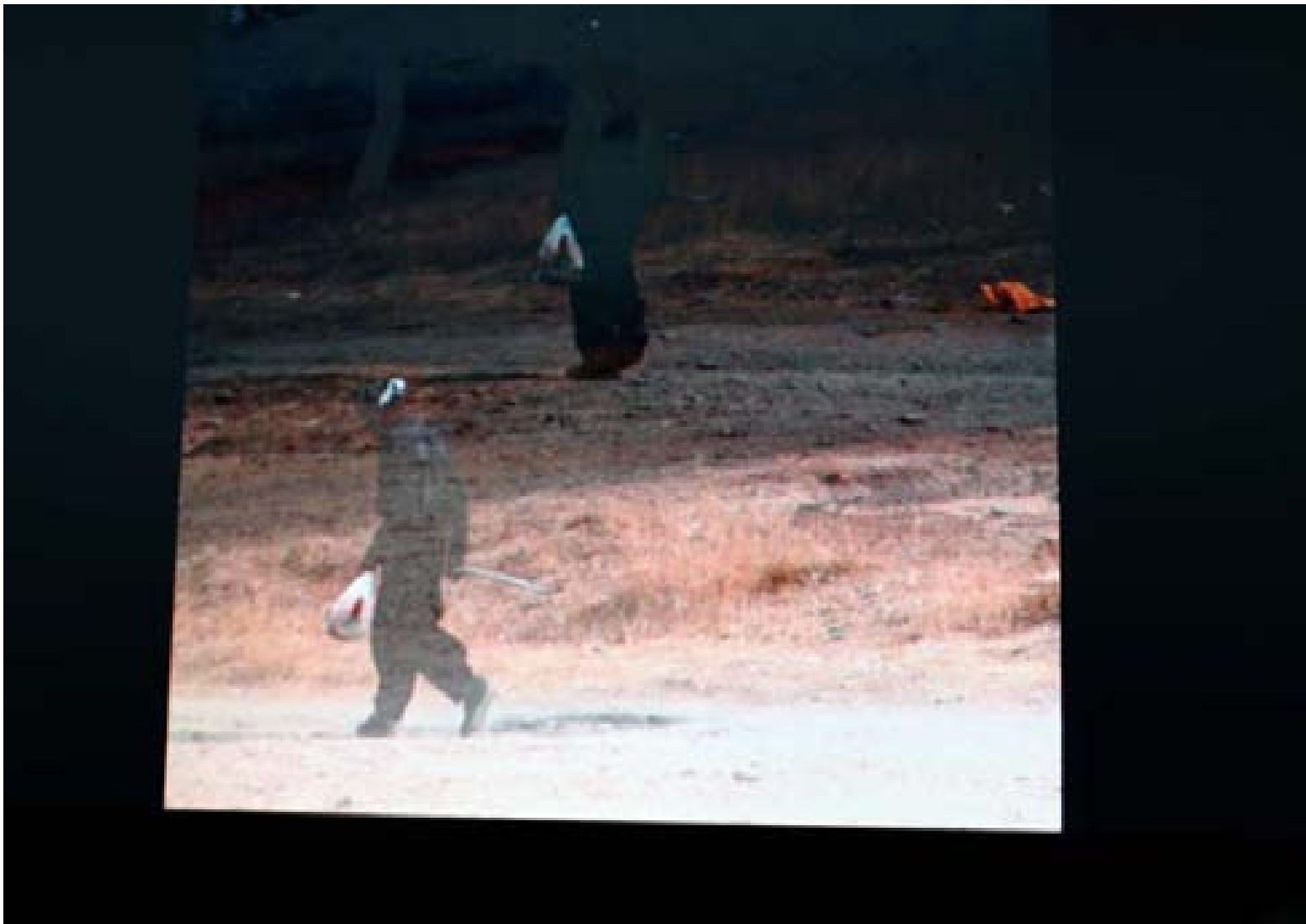
تىكەلبوونى وینەى پیاویك لەگەل تارمايیەكەیدا، ھەریەك بە ئاراستەبەكى ھاوتەربیدا دەرۆن

ئیمەوھ لەئارادایە. سۆران نەقشبەندى تەنھا بەشیکردنەوھى تلسکۆبانەوھ له ئاویئەو وینەى تەلەفزیۆنى دەروانى، ھەولەدات ھەلینجانی خۆى لەھەمبەر راستى دەرەوھ وەكو خۆى پیمان بناسیننیت، گرنگ نىبە بابەتەكانى وینەكانى چین، گرنگ ئەوھیه كه ئەو راستیەكان بەم شپوھیه دەخاتە روو، كهواتە وەكو وەرگر دەتوانین پرسین كه ئایا وینەكانى سۆران نەقشبەندى لەسیدەرەدانى راستیە یاخود ھەلسوكەوت كردنى ھونەرمنەدانەى تىدايە؟ ئەوھى كه بەھاو قورسایى دەبەخشینت بە وینە ئەو پەبۆھندییەیه كه وەرگر لەگەل وینەدا دروستى دەكات.