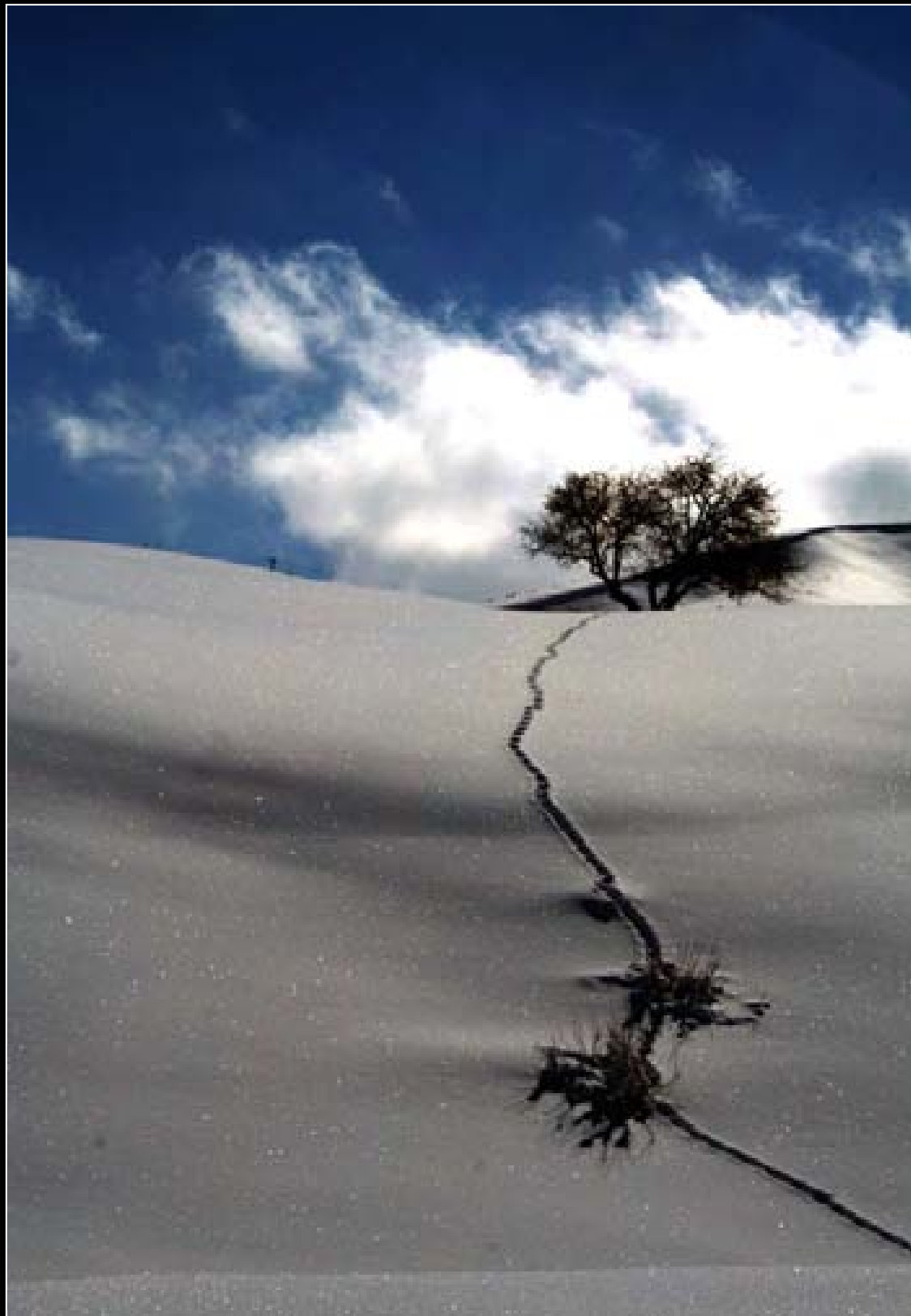
پەيوەندییەکانی درەخت بە بەفرەوه له ناوچهکانی کوردستان