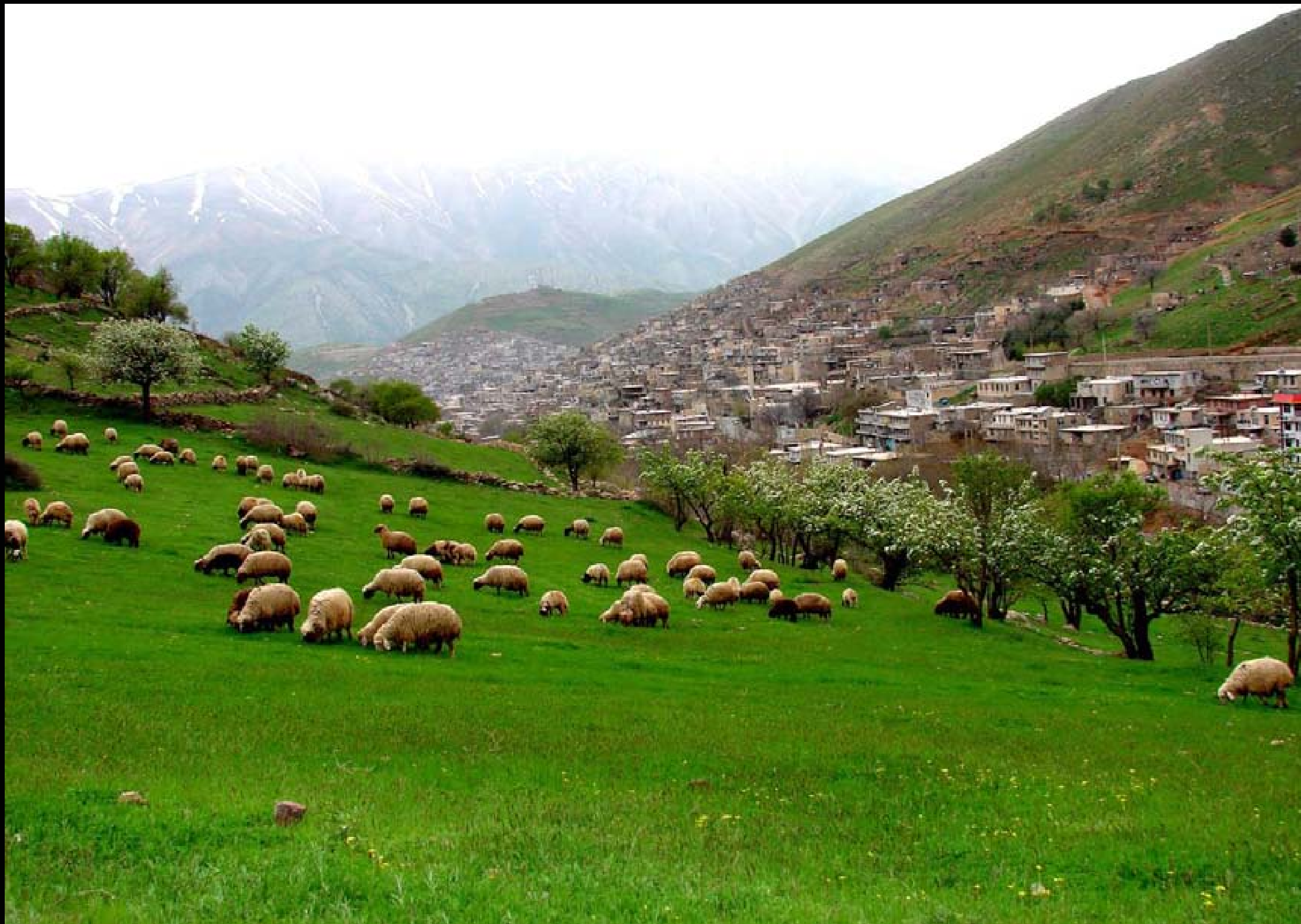
ئاژهلداری له گوند و چه م و دۆلهکانی کوردستان