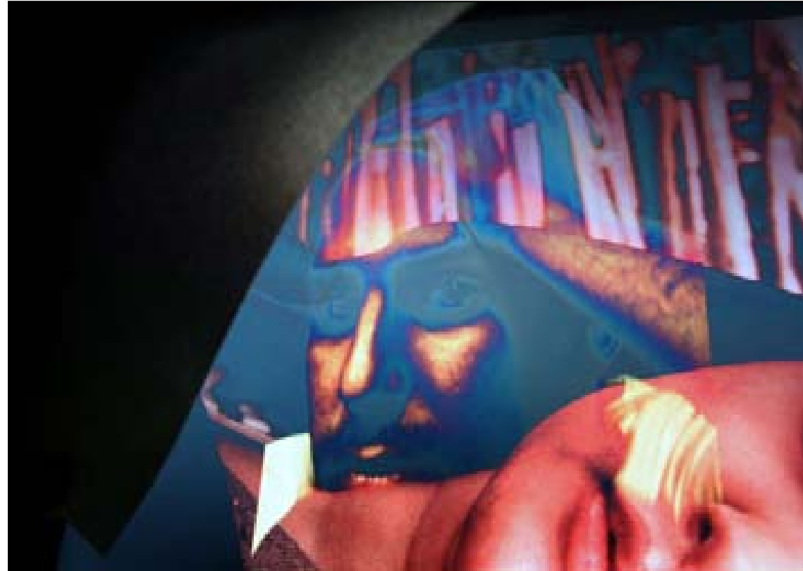
فلاش باکی سیمای پیایو یک له سهر وینهی پورتیریتی ئافره تیکی گهنج