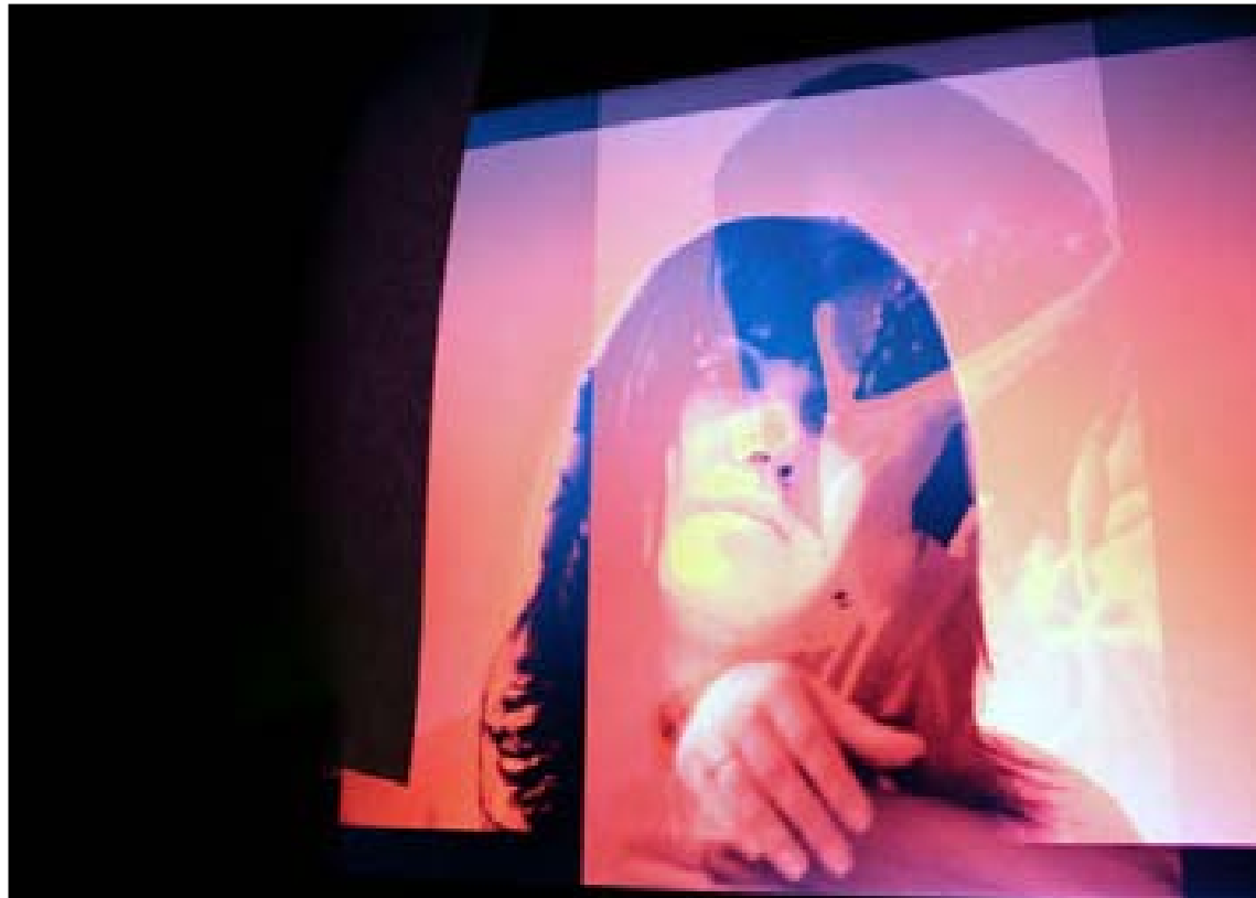
يهك ئافرهت به دوو شيوازي وهستاني جودا به لام له يهك وينهی فوتوگرافيدا