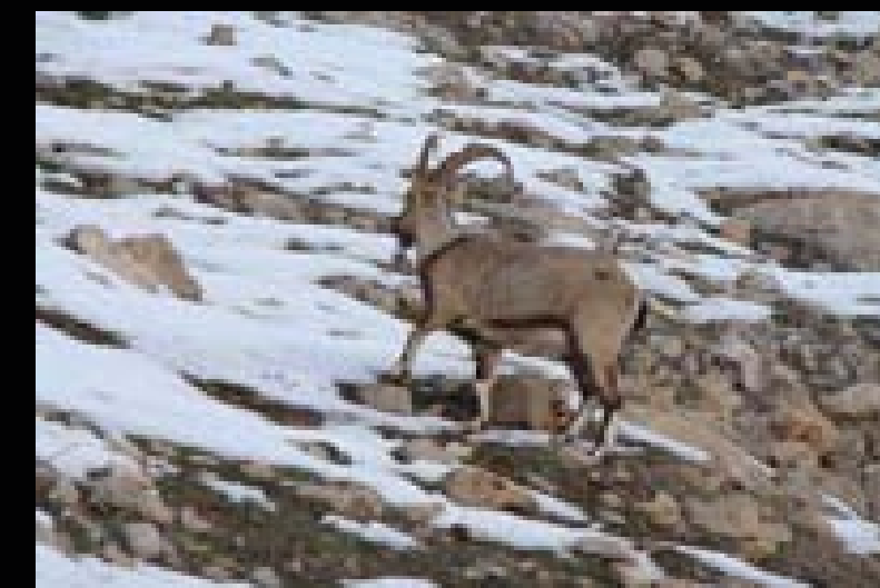
بزنه کيوی له سهه چلکه به فری هاوینی چیا به کان