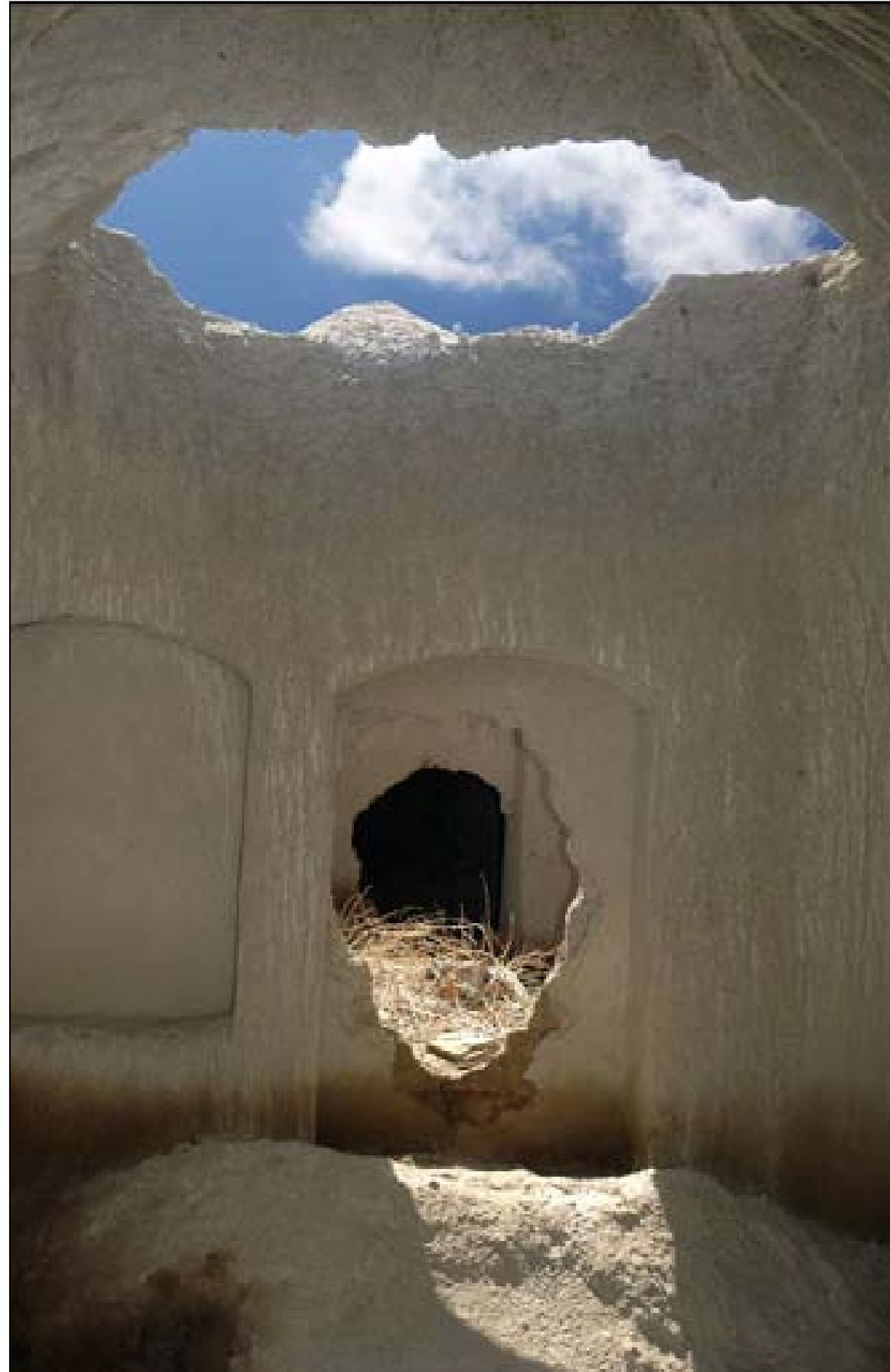
تمازج الطبيعة والتراث

رووناکی سروشت له ده لاقه ی چهنده شه به قیگدا رؤده چیتته نیوه ناسه واری خانویه کی دیرین