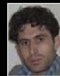
غه ریب جان

وینهی لاندسکه یب گوشه و خالی گونجانی تایه تی دهوی، بۆئه وهی وینه گر لینهی بچینه ژوره وه و سه نته ری سه رنجدان بخاته سه ر لایه نیکی نه و سروشتهی وینهی ده گریت، هه ندی جار له که شیکی ته م و مژاویدا سروشتیکی رهنگین دهرده چوینتریت، جاریش هه بووه هارمۆنیای رهنگه کان که شیکی ته نر نامیزو سه بریان به چاو به خشیوه. ته م فۆتۆ دیمه نانهی (غه ریب جان) هه ولیکن بۆ وینا کردنی نه و لایه نانهی سروشته.