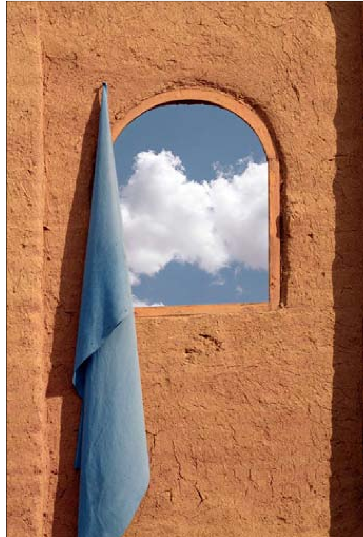
نافذة على السماء

رووناکی سروشت له ده لاقه ی چهنده شه به قیگدا رؤده چیتته نیوه ناسه واری خانویه کی دیرین