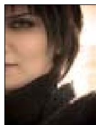
سه هر نه رجومه ندى

ویننه کانی (سه هر نه رجومه ندى) روانین ده به خشنه قولایی دیمهنه وه، به تایبه تی نه م خه سله ته له ویننه ی یکه مدا به دیار ده که وئ، له ویننه کانی دیکه شدا دیمهن له ناو دیمهن له شیوه ی دهق له ناو ده قدا دیمهنه کان ئاویزانی نیو یه کدی ده بن.